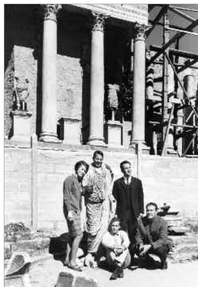
El Instituto Arqueológico Alemán ha generado en sus 78 años una impresionante colección de fotografía

exposición como homenaje a los fotógrafos que engrosaron el equipo del Instituto Arqueológico Alemán como parte fundamental de su labor. Una institución histórica que ha servido de enlace entre la arqueología hispana y la alemana y es además una de las instituciones extranjeras con más arraigo en nuestro país, fuente inagotable de actividad desde su fundación. Fotógrafos a quien se ha reservado un lugar con nombre propio a lo largo del montaje expositivo y cuya personalidad, técnica y circunstancia se intuye en el recorrido a través de la Prehistoria, la España romana o la Edad Media por la que nos invitan a pasear sus instantáneas. La Menorca talayótica, el norte prerománico, la Mérida Imperial o el sur Ibérico son algunos de los hitos arqueológicos captados por las cámaras de estos hombres, pero también la labor del arqueólogo a pie de excavación o la de la España costumbrista que mira con curiosidad los hallazgos o la de los propios fotógrafos en el ejercicio de su labor. La exposición se acompaña de un catálogo que recoge textos sobre la historia y actividades del Instituto Arqueológico Alemán de Madrid así como de su archivo fotográfico y sus fotógrafos, nutrido con las fotografías que se pueden ver en la muestra.